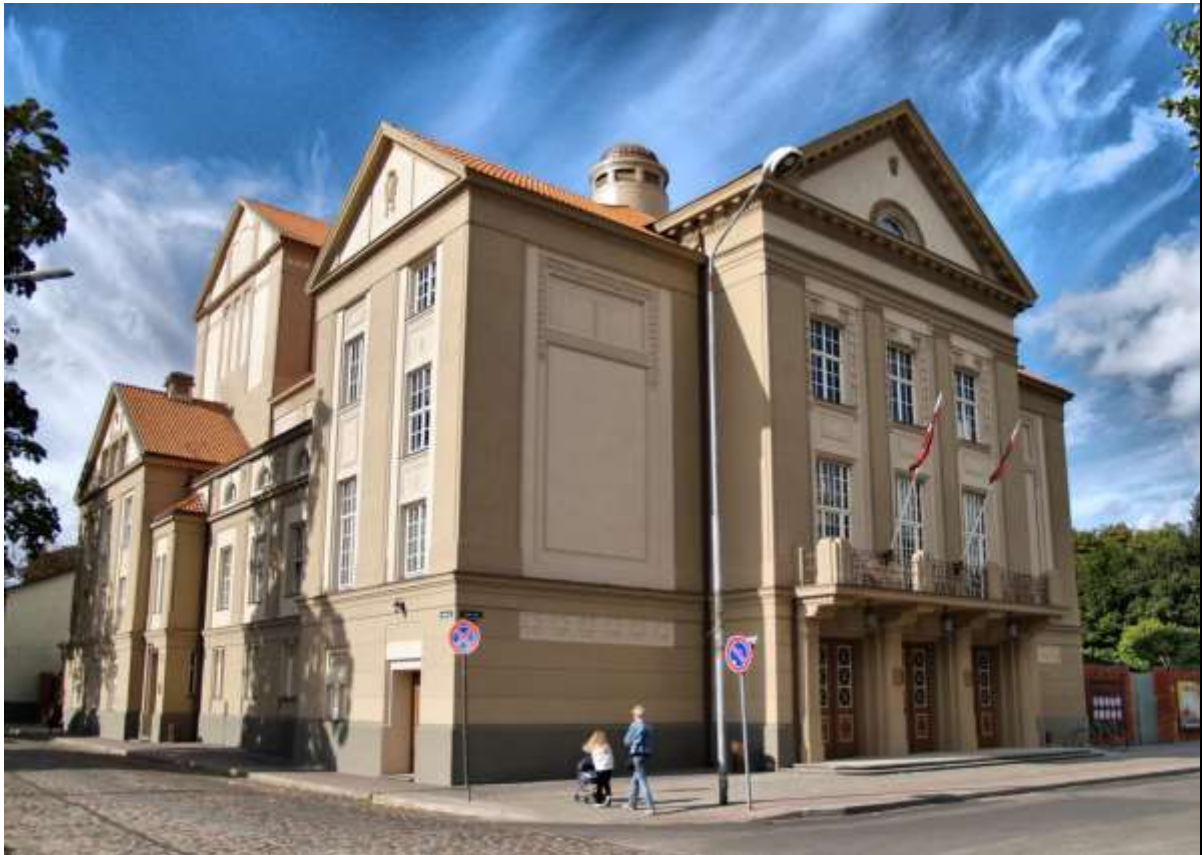
Rekonstruētā Liepājas teātra ēka 9