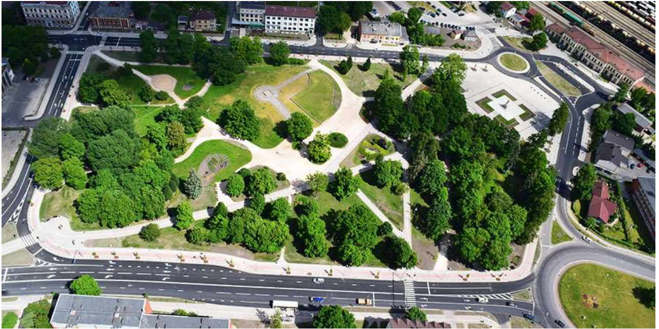
Rekonstruētās pilsētas ielas dzelzceļa stacijas apkārtnē 12