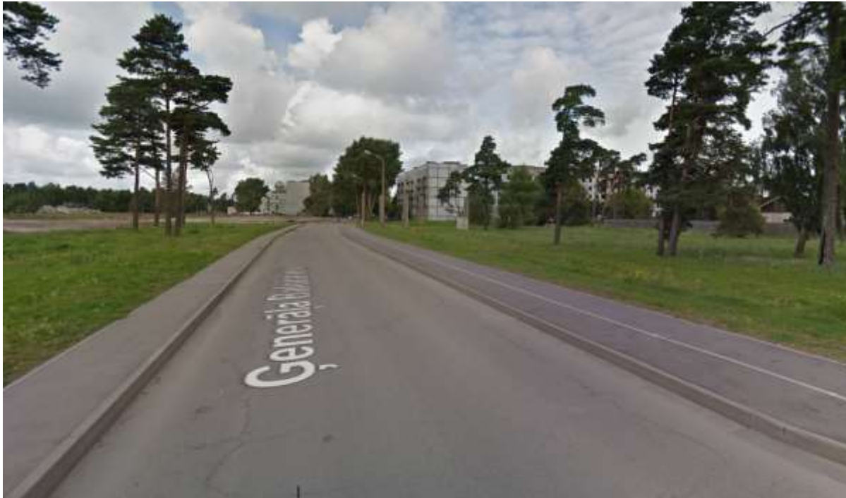
Ģenerāļa Baloža iela Liepājā 11