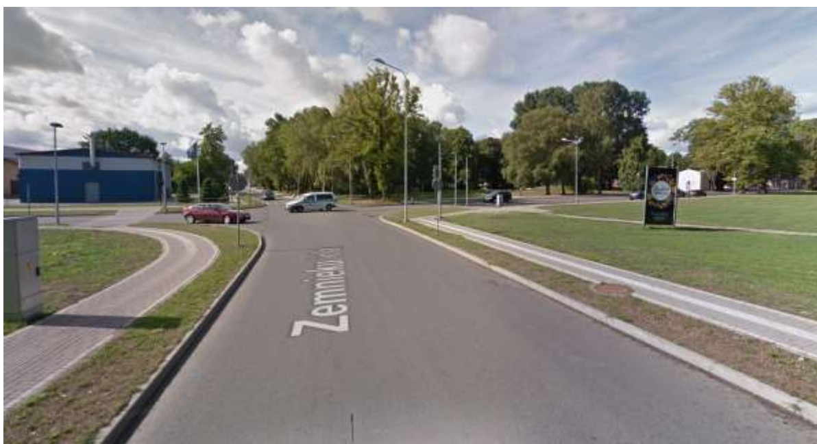
Zemnieku iela pēc rekonstrukcijas 7