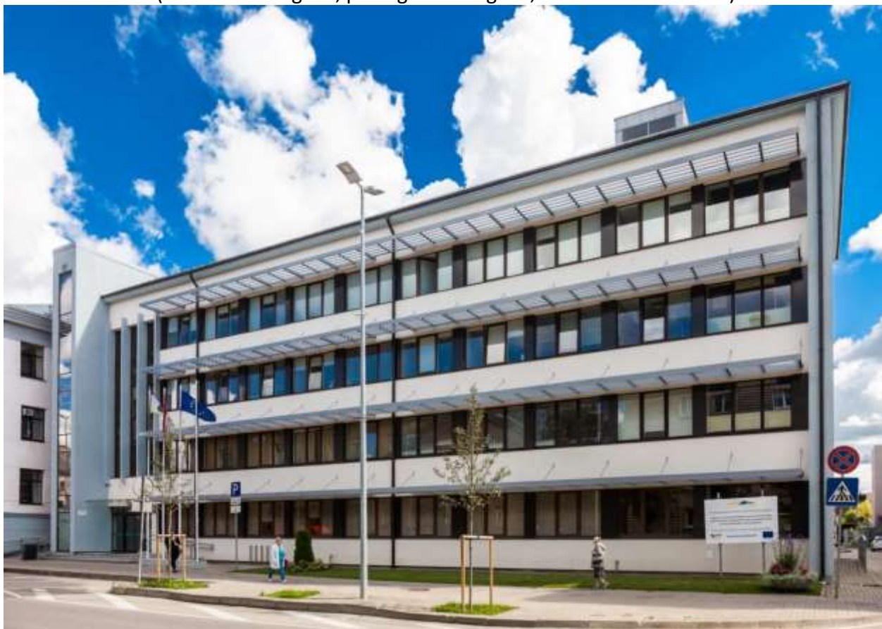
Jelgavas novada pašvaldības administratīvā ēka Jelgavā 10