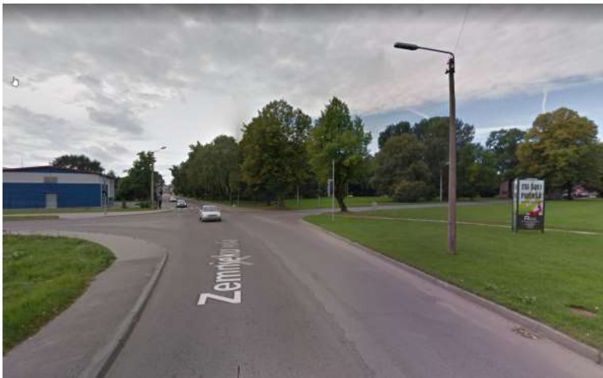
Zemnieku iela pirms rekonstrukcijas, 2011. gads 6

(uzsākts 2013. gadā, pabeigts 2015. gadā, īstenots 23 mēnešos)