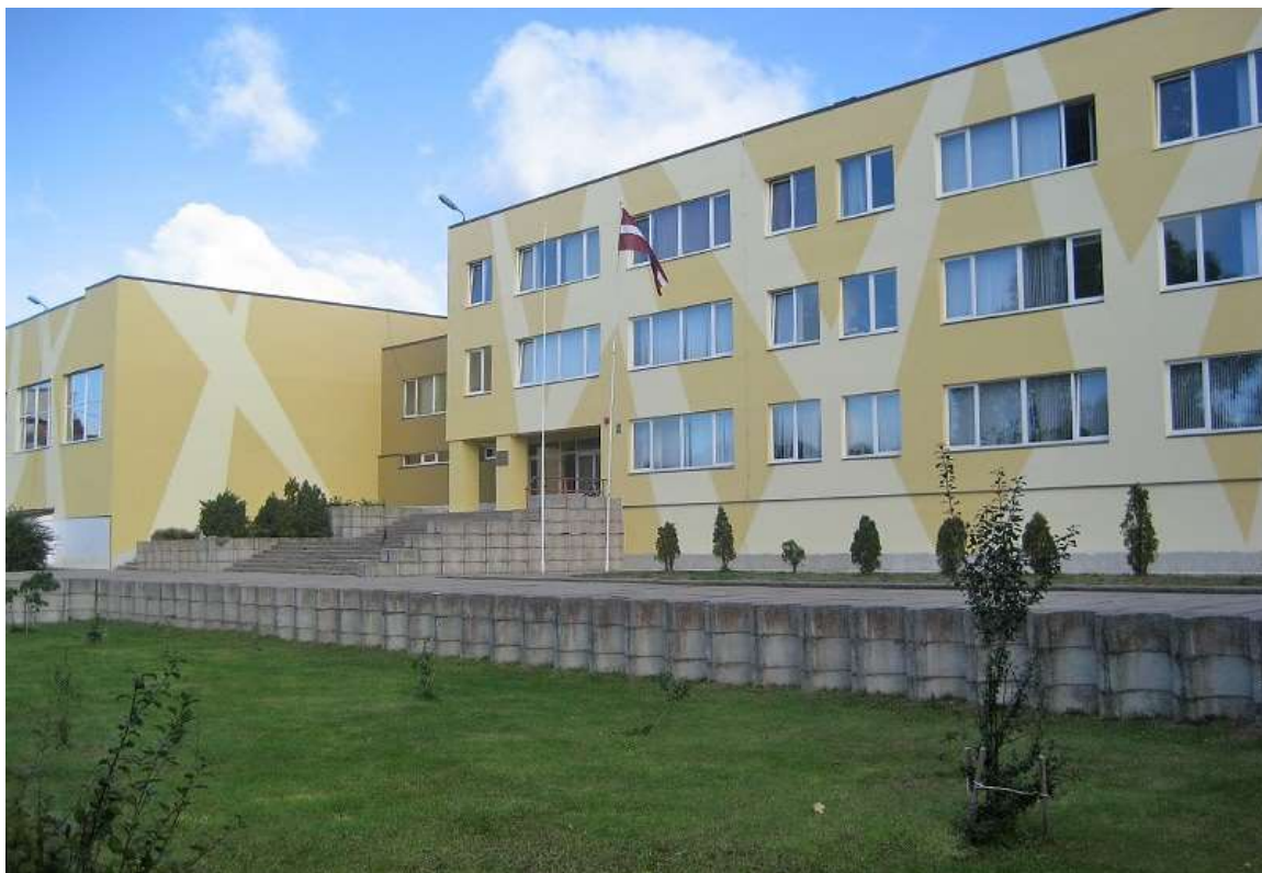
Liepājas 8. vidusskola pēc projekta īstenošanas 5