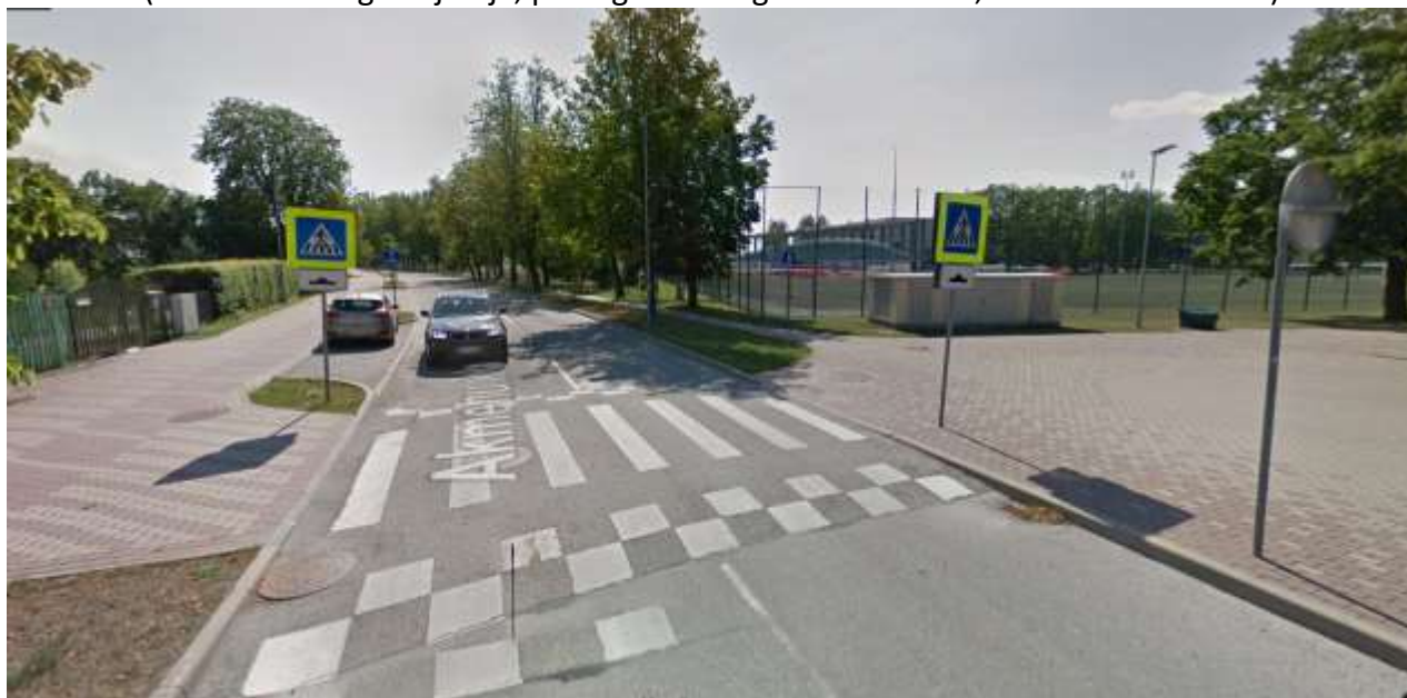
Akmeņu iela pēc projekta īstenošanas 7

(uzsākts 2009. gada jūnijā, pabeigts 2009. gada decembrī, īstenots 6 mēnešos)