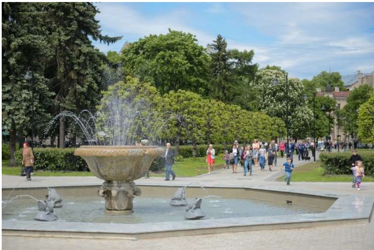
Ziedoņdārzs pēc projekta īstenošanas 9