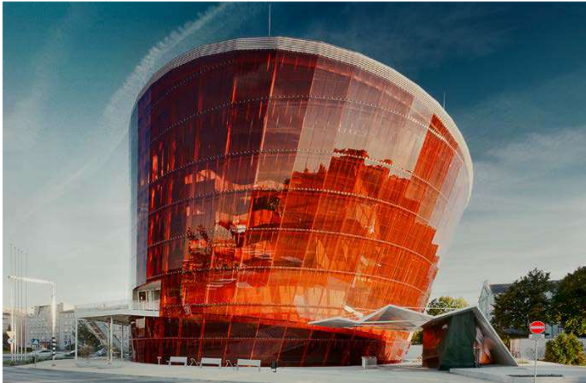
Koncertzāle „Lielais dzintars” 12