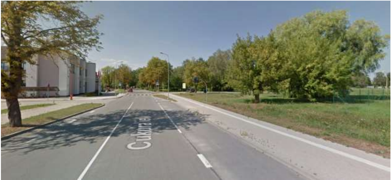
Rekonstruētais Cukura ielas posms 11