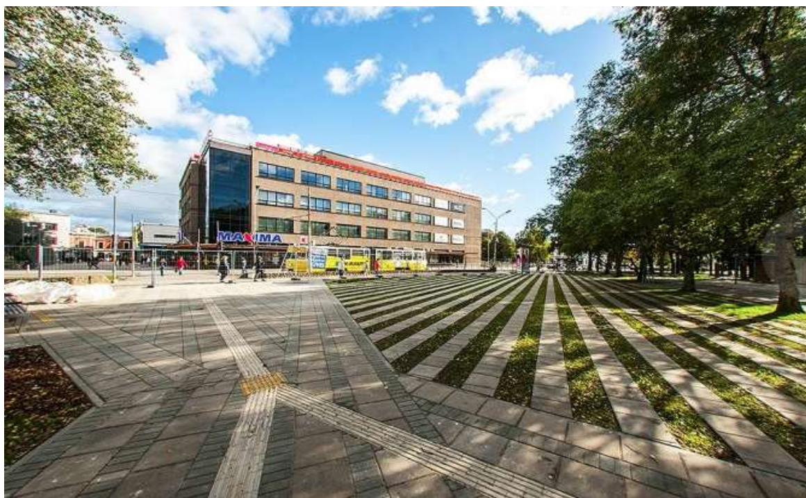
Atjaunotais Lielās ielas skvērs, 2013. gads 8