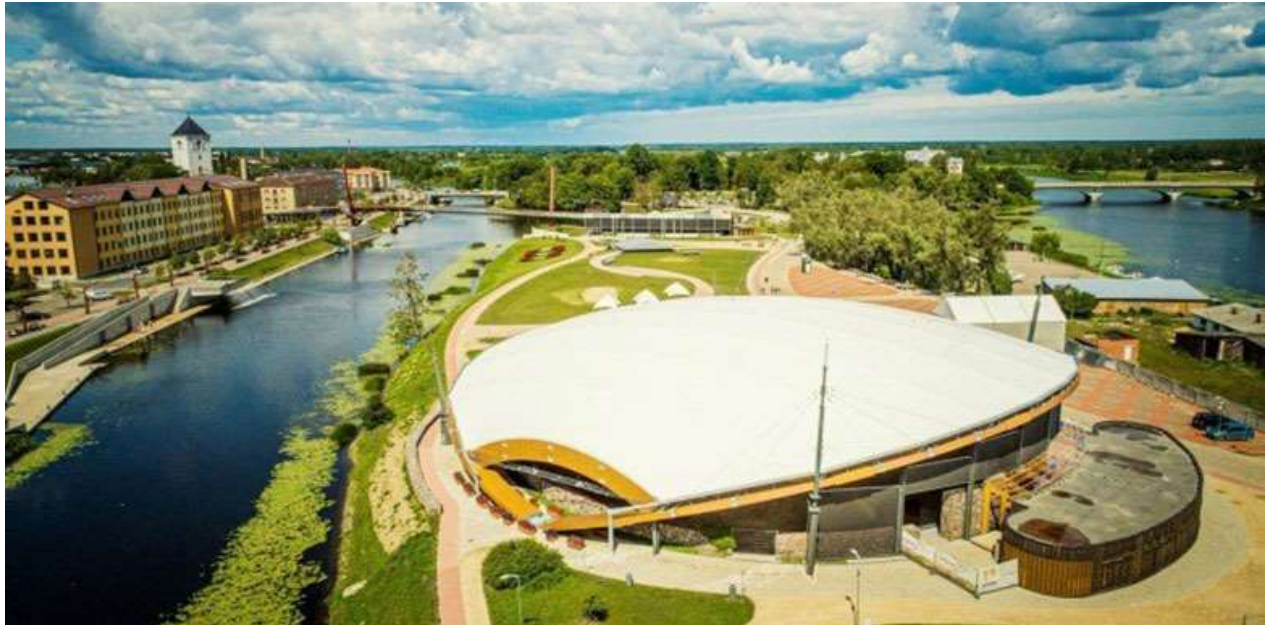
Pasta sala Jelgavā, 2019 9