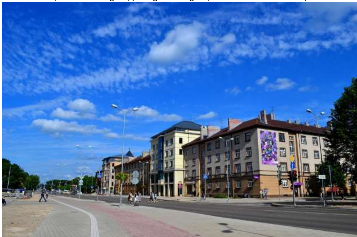
Lielā iela Jelgavā pēc rekonstrukcijas 5

(uzsākts 2000. gadā, pabeigts 2010. gadā, īstenots 21 mēneša laikā)