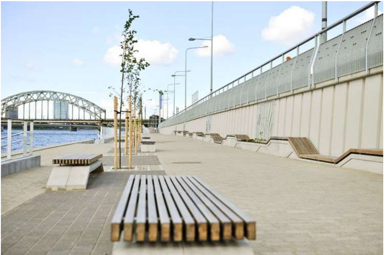
Rekonstruētā un labiekārtotā Daugavas krastmala posmā no Akmens tilta līdz Salu tiltam 8