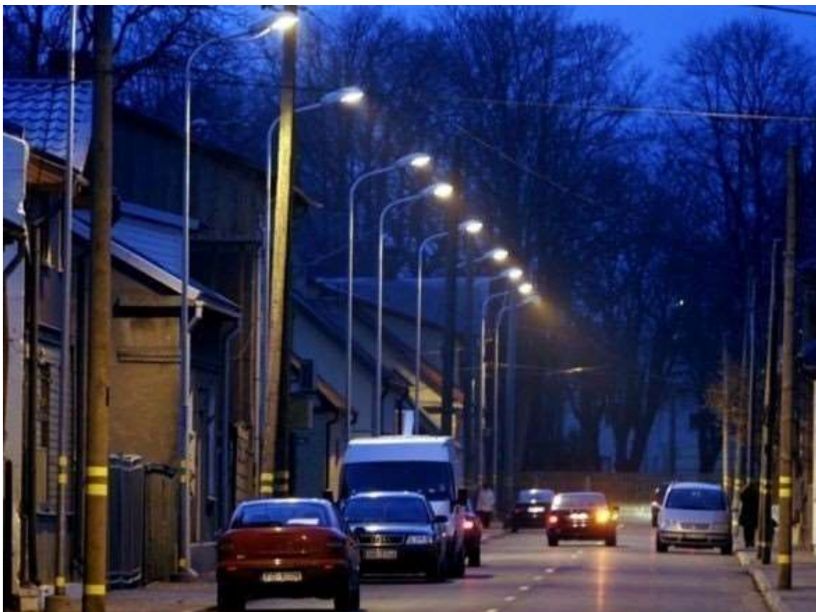
Modernizētais ielu apgaismojums Liepājā 10