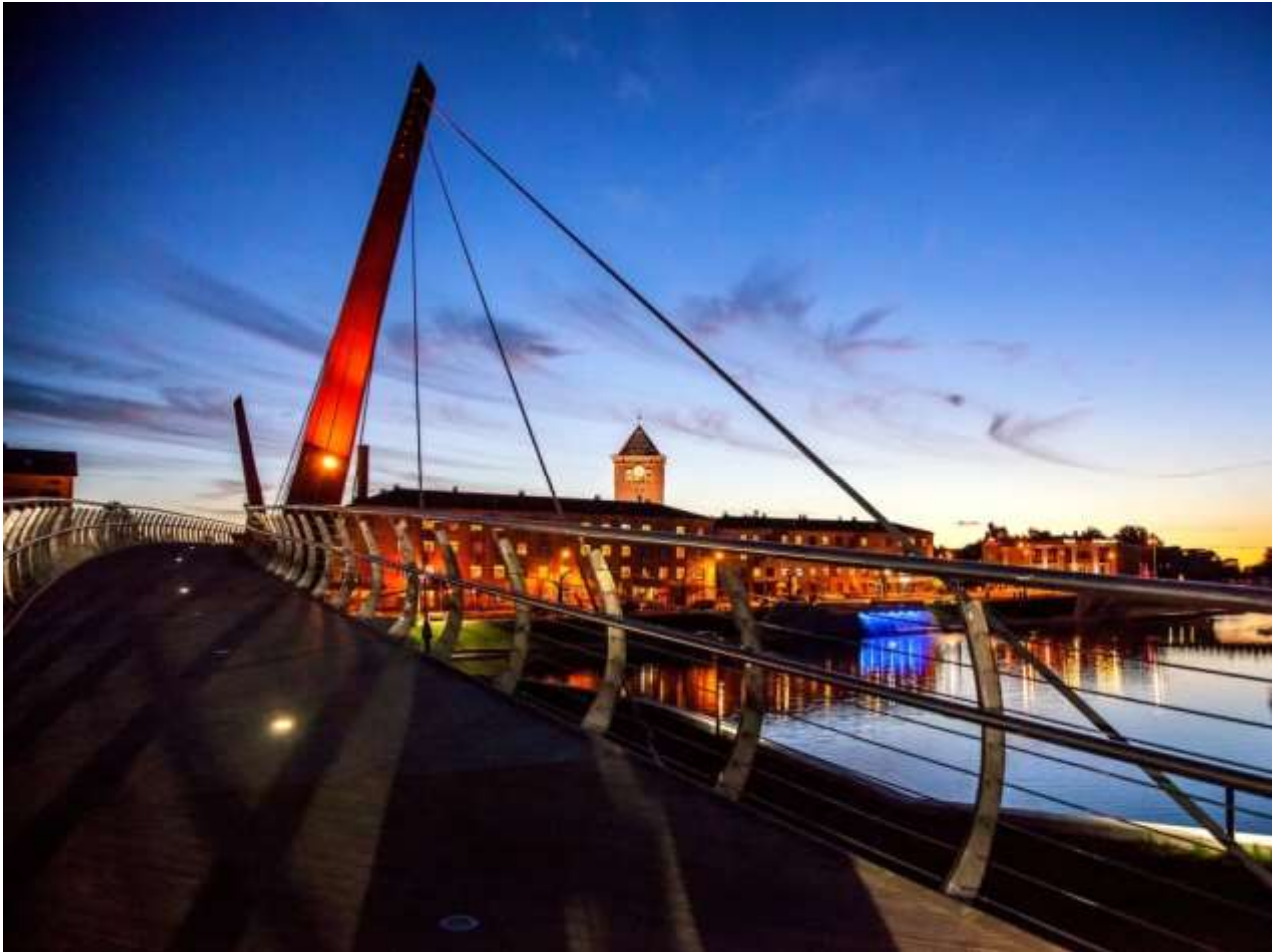
Mītavas tilts Jelgavā 8